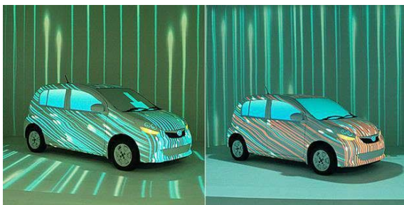
Gambar 3. Video mapping pada mobil

image dengan berbagai gambar, motif, corak tidak hanya ke mobil dan rodanya, juga ke dinding tiga dimensi. Malah beberapa obyek bergerak, seperti bunga berguguran. Hal ini cukup menarik bagi penonton, terbukti banyak yang menjepret kamera diam atau video – baik sebagai kenangan maupun latar belakang ketika video mapping ini ditayangkan di booth Daihatsu.